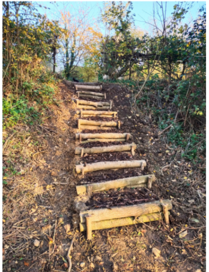
Première étape. la construction de l'escalier d'accès.