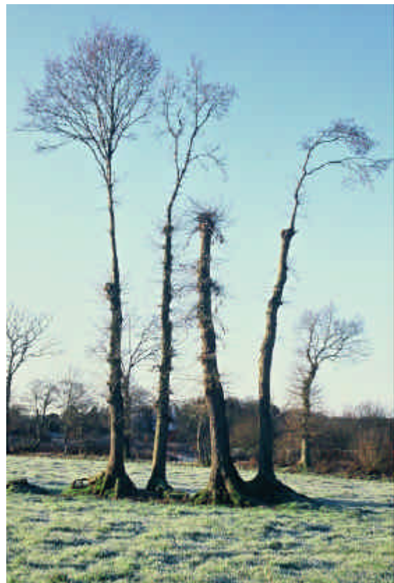
Chênes émondés depuis 1 an, avec conservation de tire-sève

Autrefois il fallait monter dans l'arbre et, en commençant par la tête, couper toutes les branches pour les faire redescendre. Il s'ensuit une repousse qui peut être très dense. Ce mode d'émondage produit des branches beaucoup plus fines que celle des têtards, et destinées au fagottage. A cause de la finesse de l'arbre, c'était une aventure de monter en haut de l'arbre pour couper les branches. Elles ne constituent pas du tout les barreaux d'échelle qu'on voit sur les arbres les plus massifs. On imagine, comme un passereau sur un brin d'herbe, que la ragosse va se plier quand l'émondeur sera en haut. On se demande comment on a pu aller couper les branches de certains arbres sans nacelle