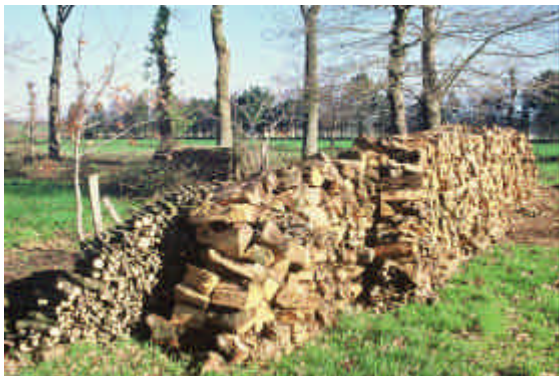
Sur ce tas de bois contemporain, le tri des différentes qualités de bûches perdure selon les catégories décrites dans les octrois du 19 e siècle

Ces cycles d'émondage sont bien inscrits dans les cycles de production agricole, au même titre que les autres cultures. Dans les baux, on trouve systématiquement des mentions de plesses jusque dans les années 1890.