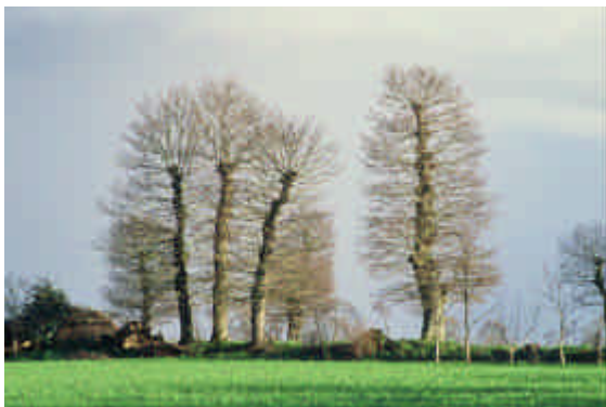
En l'absence de tire-sève, la repousse des branches est plus homogène

Les charmes sont plus couramment conduits en port bas, en haies de jardin, en haies basses. Ils n'étaient pas tellement appréciés des anciens parce que, très denses, il était assez difficile de monter dans l'arbre et de l'émonder. De plus, le charme étant un bois qui se conserve assez mal, les fagots se dégradent très vite, et il fallait les consommer dans l'année.