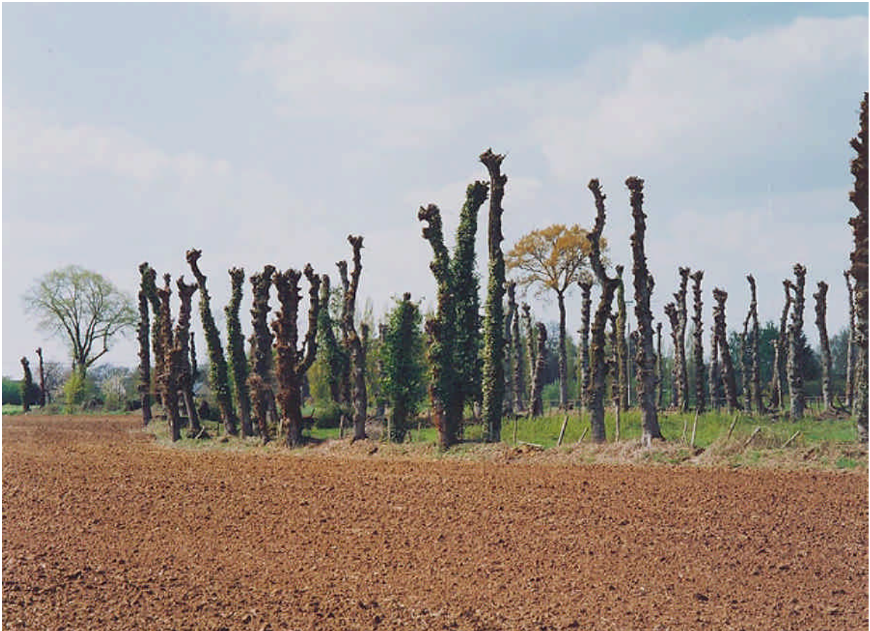
Commune de Clayes à côté de Rennes, près du terrain de foot